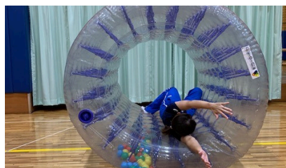
サイバーホイール