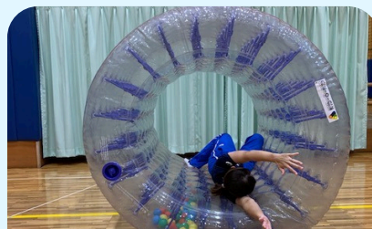
サイバーホイール